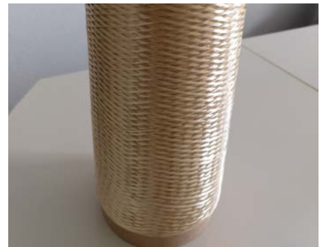
Ungebleichte Endlosfaserspule aus Hanfschäben, hergestellt nach dem Lyocellverfahren

Das Institut für Pflanzen- und Holzchemie (IPHC) an der Technischen Universität Dresden befasst sich u. a. mit der Produktgewinnung aus Zellstoff. Ein Schwer-